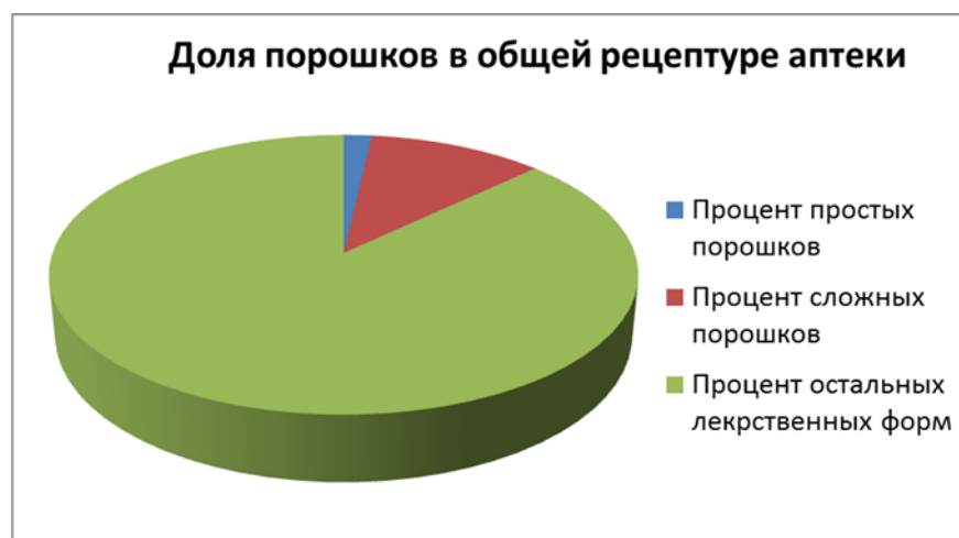
Рис. 1. Доля порошков в общей рецептуре аптеки