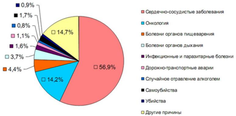
Диаграмма 1. Процентное соотношение смертности в мире